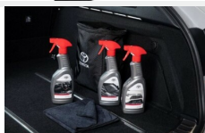
Zestaw kosmetyków samochodowych Toyota Kosmetyki