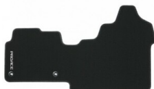
Dywaniki tekstylne (czarne) Dywaniki / Wykładziny