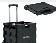
Skrzynka bagażowa Gadżety