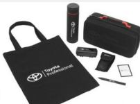
Zestaw prezentowy Professional Gadżety