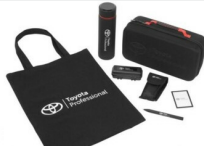
Zestaw prezentowy Professional