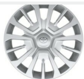
Kołpak ProAce City 16"

Toyota PROACE 2.0 Diesel YARVFEHTMGZ247984