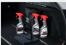
Zestaw kosmetyków samochodowych Toyoty